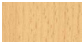
LTD BUK 3660x1830x16mm